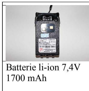
Batterie li-ion 7,4V 1700 mAh

son aussitôt les motifs de mon choix d'une méconnaissance de la marque et de la fabrication made in china, on a toujours tendance à se méfier. Bel emballage soigné et je dois dire agréablement surpris car la notice est exclusivement en anglais. Mais bon suite à ce petit tracas je décide de mettre en route le petit portatif et de trouver sur le net un petit condensé en français afin de pouvoir me servir des principales fonctions de l'appareil. Après avoir mis en charge le Wouxun sur son socle chargeur fourni dans la boîte. La batterie li-ion de 7,4 Volts et 1700 m A se charge rapidement, point plutôt positif lorsque l'on vient de recevoir son