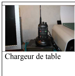
Chargeur de table