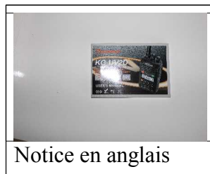
Notice en anglais