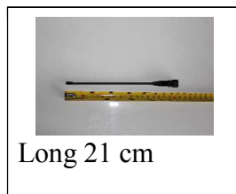
Long 21 cm

une charge complète de premiers réglage avec la prise sur internet pour le emploi de celui ci.