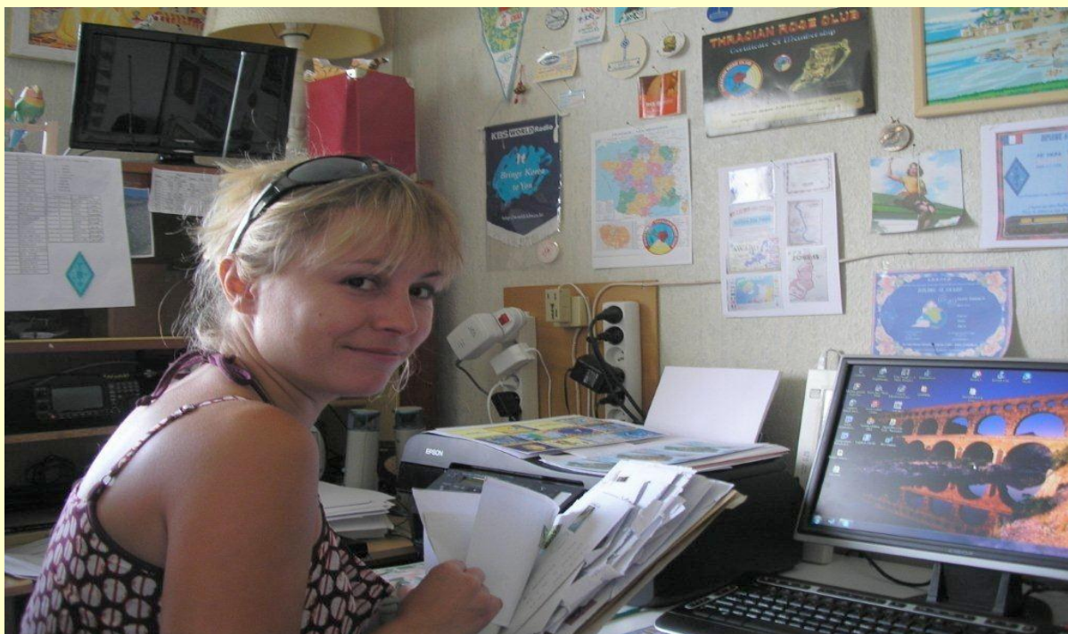
Directrice du Service QSL F-20711

Pour les nouveaux et futures SWL voici quelque conseils au sujet de votre carte QSL.