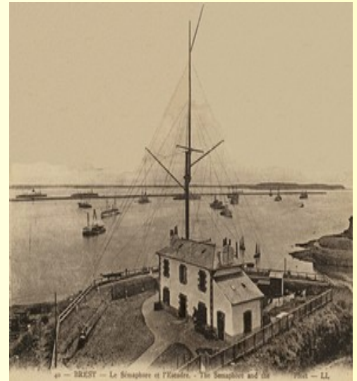
Station de Marconi

1801 : Dupillon officier artiller se servant du matériel des frères Chappe invente : le sémaphore celui-ci permet une liaison entre Bayonne à Flessingues